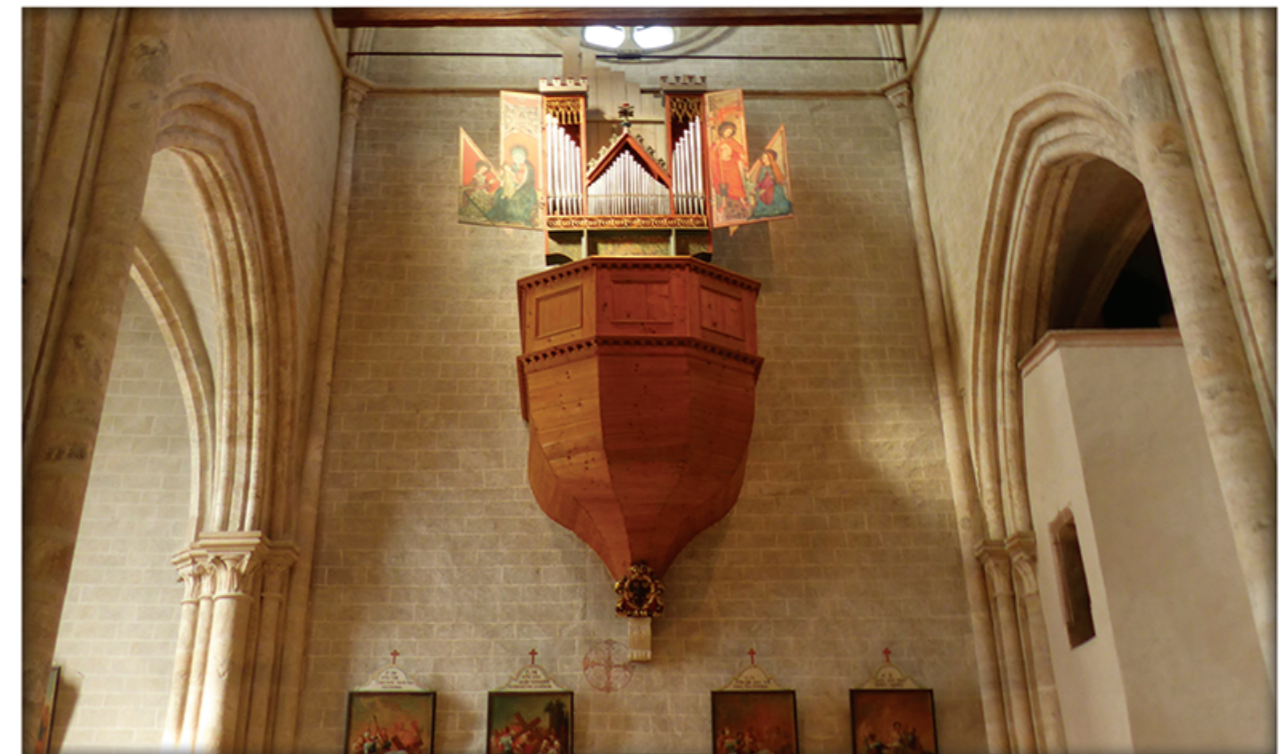
Basilique de Valère - Basilica of Valère - Basilika von Valeria

I'd like to take this opportunity to thank the College of Scientists, who took on this difficult interdisciplinary challenge, as well as the speakers and participants from all over the world. We acknowledge the scientific and organizational support of the Catholic University of Lille-France, the University of Fribourg-Switzerland, the Swiss Italian University, Lugano, the