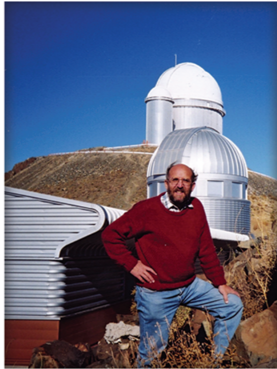
L'astrophysicien Michel Mayor Prof. Dr Phys. Dr h.c. mult. Prix Nobel de Physique A l'Observatoire Européen de La Silla (ESO, Chili)

Pour la référence scientifique de la Conférence interdisciplinaire LAUDATO SI' Sion 2023, nous avons retenu : la découverte majeure en 1995 des astrophysiciens Michel Mayor et Didier Quéloz (voir page ci-contre) ; les travaux de la chimie de l'atmosphère de Paul J. Crutzen, Mario Molina, Frank Sherwood Rowland ; les travaux en biologie moléculaire, chimie et médecine de Madame Emmanuelle Charpentier , d'origine française, Prix Nobel de chimie (2020), Membre de l'Académie Pontificale des Sciences, Max-Planck-Forschungsstelle für die Wissenschaft der Pathogene, Berlin.