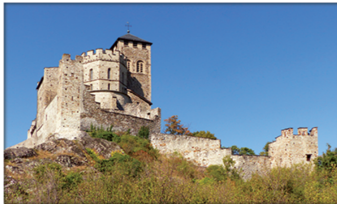
Basilique de Valère - Basilica of Valère - Basilika von Valeria

Die Konferenz Laudato Si', deren Wissenschaftskollegium ich die Ehre habe zu leiten, richtet sich an alle Menschen, ob gläubig oder auf der Suche, bereit, sich der großen Herausforderung des ökologischen Wandels zu stellen im Zeitalter des Anthropozäns, einer geologischen Epoche, die sich durch den Einfluss des menschlichen Handelns auf unseren Planeten auszeichnet. Die "Bewahrung des gemeinsamen Hauses" geht uns alle an. Wie Papst Franziskus sagt : " Die Menschheit besitzt noch immer die Fähigkeit, zusammenzuarbeiten, um unser gemeinsames Haus zu bauen ". Doch wie soll das geschehen? Unsere Konferenz möchte einen Beitrag zu diesem Bau leisten, der für die Zukunft der Menschheit und der Erde von entscheidender Bedeutung ist. Zu diesem Zweck wird sie Wissenschaftler aus den Bereichen Astrophysik, Physik, Ingenieurwesen, Chemie und Biologie, aber auch Mediziner, Wirtschaftswissenschaftler und Juristen, Philosophen, Theologen und spirituelle Menschen zusammenbringen, um sich über die ökologischen Herausforderungen auszutauschen. Eine breit angelegte Debatte mit den Teilnehmenden wird die gemeinsame Reflexion bereichern und konkrete Handlungsmöglichkeiten für den Dienst am gemeinsamen Haus aufzeigen, die sich nach den Zielen der UNO für nachhaltige Entwicklung und den Initiativen der europäischen Institutionen in diesen Bereichen ausrichten.