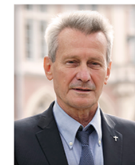
Der Präsident der Interdisziplinären Konferenz LAUDATO SI' Sion 2023 :

Möge unser vertiefter Gedankenaustausch zur integralen Ökologie dazu beitragen, die Hoffnung zu nähren und innovative und konkrete Aktionen im Dienst unseres gemeinsamen Hauses zu fördern.