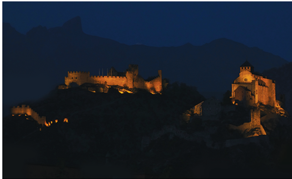
Basilique de Valère - Basilica of Valère - Basilika von Valeria

La conférence Laudato Si', dont j'ai l'honneur de présider le Collège des scientifiques, s'adresse à toute personne, croyante ou en recherche, désireuse de relever le grand défi de la transition écologique à l'ère de l'anthropocène, époque géologique qui se caractérise par l'influence de l'action de l'homme sur notre planète. La « sauvegarde de la maison commune » nous concerne tous et toutes. Comme le dit le pape François « l'humanité possède encore la capacité de collaborer pour construire notre maison commune ». Mais comment ? La présente conférence veut apporter sa contribution à cette construction, essentielle pour l'avenir de l'humanité et de la terre. Elle réunira pour cela des scientifiques astrophysiciens, physiciens, ingénieurs, chimistes et biologistes, mais aussi des médecins, des économistes et des juristes, des philosophes, des théologiens et des spirituels qui croiseront leur regard sur le défi de l'écologie. Un large débat avec les participants permettra d'enrichir la réflexion commune et de tracer des pistes concrètes d'action pour le service de la maison commune, en lien avec les objectifs de développement durable de l'ONU et les initiatives des Institutions européennes en ces domaines.