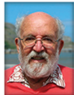
Prof. Dr. Phys., Dr h.c. multi Michel Mayor Prix Nobel de physique (astrophysique), 2019 Prof. Honoraire, Université de Genève

Aux Membres du Collège des Scientifiques, composé de :